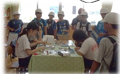
(小学生部活動見学より)

2学期がスタートしました。夏休みはどのように過ごしたでしょうか。長いようで、あっという間の日々だったと思います。この夏休みで、心と体がとても大きく成長したと思います。2学期、そんなみなさんの活躍を期待しています。